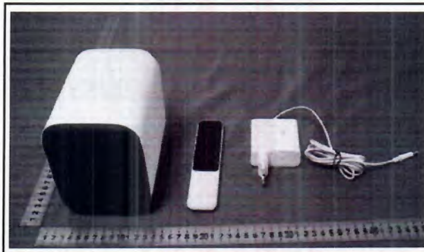
Imagen en color del producto: