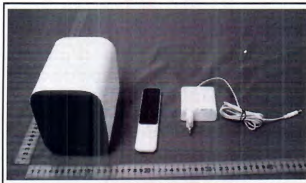
Immagine a colori del prodotto: