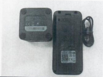
Imagem a cores do produto: